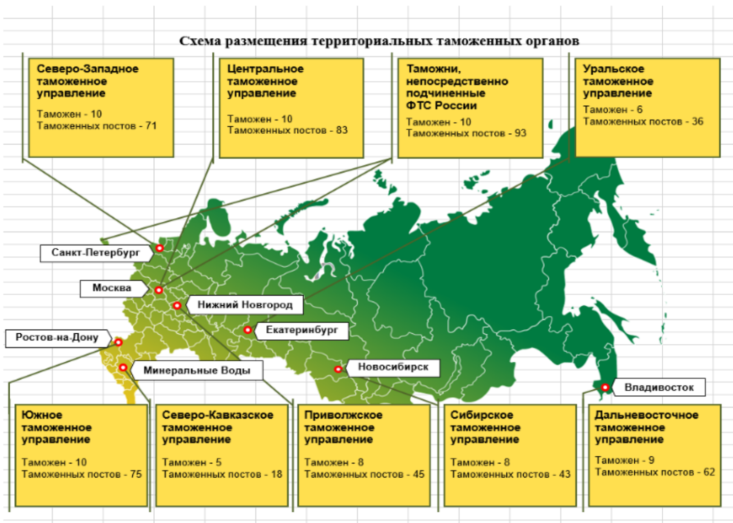
Схема размещения территориальных таможенных органов.

Актуальную информацию о перечне и структуре таможенных органов вы сможете найти по ссылке: